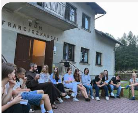
Duhovna obnova s 29 mladih u Duklji, provincija Bezgrešno Začeće (Poljska)