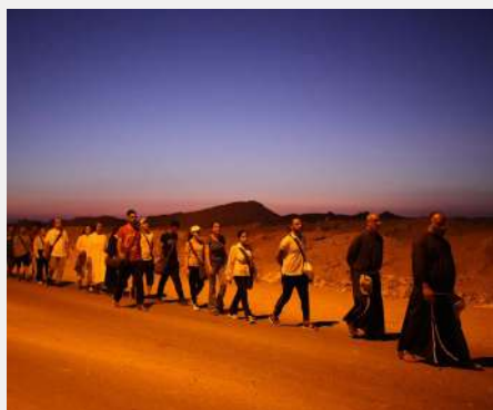
Franjevački hod u Egiptu, provincija Sveta obitelj