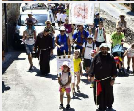
Franjevački hod obitelji, provincija Serafica sv. Franjo Asiški (Italija)