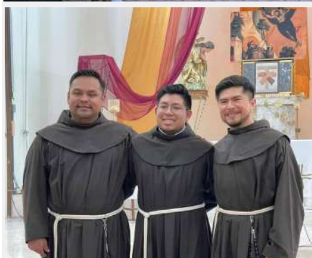
Završetak kanonskog mjeseca, provincija Sveti Filip od Isusa (Meksiko)