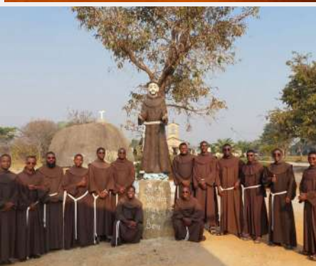
Prvo zavjetovanje novakinja fondacije Bezgrješne Majke Božje (Angola)